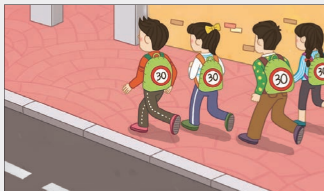
'가방 안전 덮개'는 스쿨 존 내 제한 속도인 '30'을 큼지막하게 표시해 운전자가 볼 수 있도록 한다.

주거 지역에서 발생한 어린이 사망 사고의 주요 원인은 운전자의 안전 운전 불이행이다. 총 17명의 목숨을 앗아 갔다. 안전 운전 불이행이란 운전자가 정확하고 올바른 운전을 하지 않은 경우를 말한다. 졸음운전 등에 의한 전방 주시 태만, 속도 제한 위반과 같은 난폭 운전 등을 포함한다. 이어 보행자 보호 의무 위반(3명), 신호 위반(1명) 등으로 나타났다.