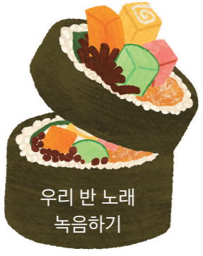
우리 반 노래 녹음하기

2 우리 반 노래를 녹음하고 들으며 가상 악기로 즉흥 리듬 반주를 해 봅시다.