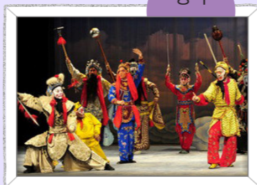
노래, 대사, 동작, 무술이 어우러진 중국의 전통 음악극