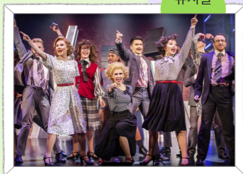
대중적인 노래와 음악, 춤이 이야기를 이끌어 가며 20세기에 영국과 미국을 중심으로 발전한 음악극

2 오페라의 특징을 생각하며 오페라 “마술피리”의 한 장면을 감상해 봅시다.