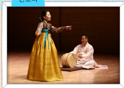
한 명의 소리꾼이 고수의 북 반주에 맞추어 이야기를 엮어 나가는 우리나라 고유의 음악극