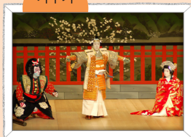
음악, 무용, 기예가 어우러진 일본의 전통 음악극