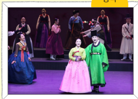
소리꾼들이 배역을 나누고 국악 관현악 반주에 맞추어 이야기를 엮어 나가는 우리나라의 음악극