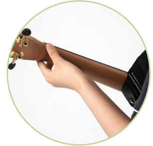
▲ 왼손 뒷면

악기를 관리할 때는 직사광선을 피하고 오랜 시간 연주하지 않을 때에는 줄을 1~2바퀴 풀어서 상자에 보관해.