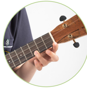
▲ 코드 운지 왼손 정면