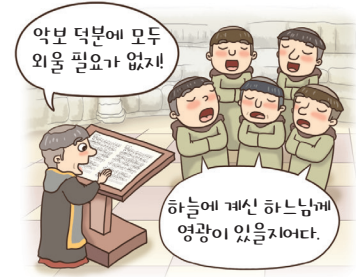
▲ 중세 교회 음악의 전성기, 기보법 창안