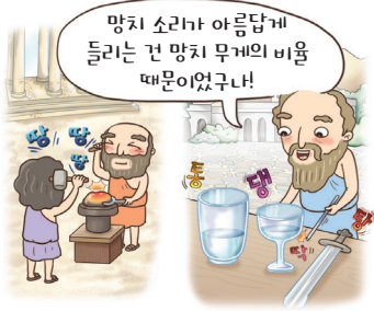
▲ 고대 피타고라스 음계