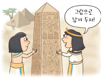
▲ 고대 이집트 음악

고대 종교 의식이나 행사를 위한 음악이 주로 발달하였고, 아울로스, 기타라, 하프 등의 악기가 사용되었다. 중세 서양 음악의 기본적인 형태가 만들어진 시기로 종교 음악이 크게 발전하고 세속 음악도 출현하였다.