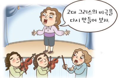
▲ 극음악 탄생과 발전