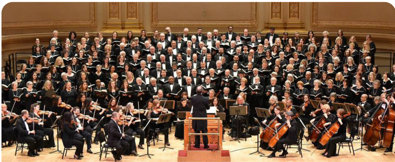
▲ 헨델 오라토리오 카네기홀 연주 모습

오라토리오 성서나 종교적인 내용을 바탕으로 한 극음악으로, 오페라와 달리 연기, 분장, 무대 장치가 없으며 독창, 중창, 합창, 관현악 등으로 구성되며 해설자가 있는 것이 특징