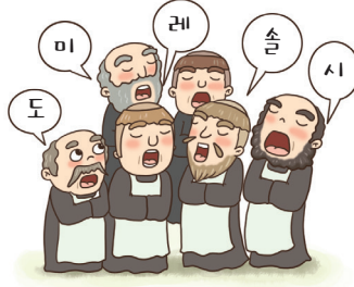
▲ 다성 음악 완성