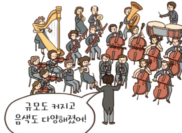
▲ 관현악법의 확대·발전