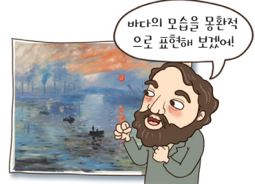
▲ 인상주의 음악의 등장과 발전