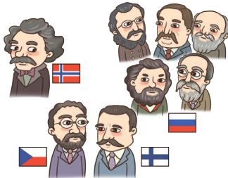
▲ 자국의 민족적 특징을 음악에 반영

19세기 말은 세기말적 징조들이 압도했던 시기로 다양한 음악적 양식이 나타났는데, 그중 민족주의와 후기 낭만주의, 인상주의 음악이 대표적이다.