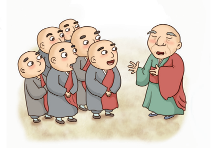
▲ 불교 음악인 범패의 수용과 발전