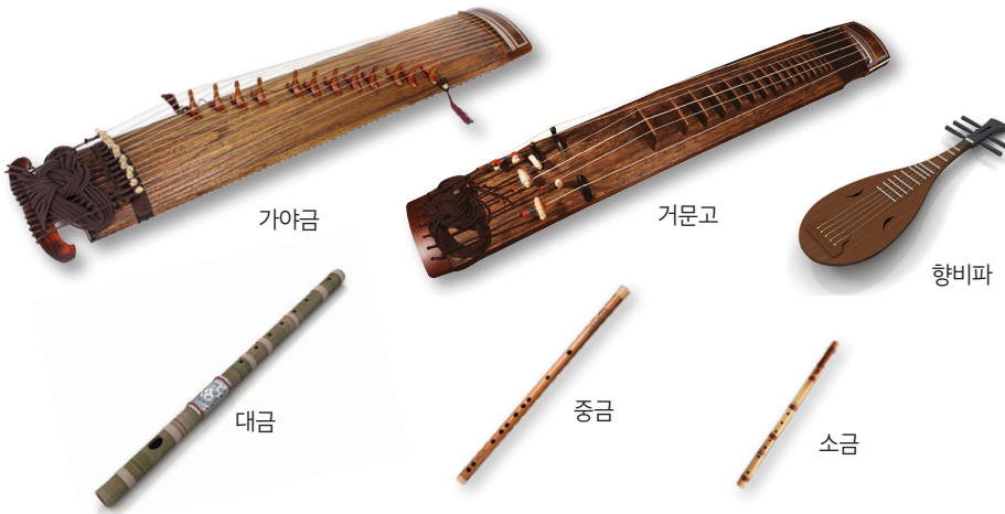
▲ 향악의 틀 갖춤(삼현삼죽 악기 편성)

삼국을 통일한 신라는 고구려, 백제, 신라의 음악을 모두 받아들여 더욱 발전시켰다.