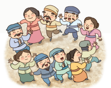
▲ 원을 그리며 노래 부르는 집단 무용 '답추'