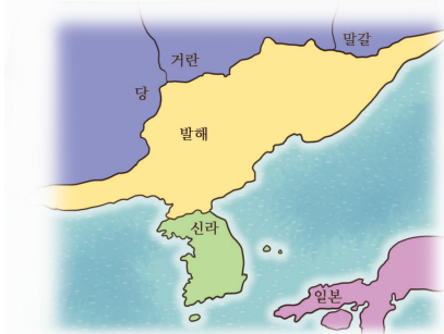
▲ 발해 영토

고구려를 계승한 발해는 영토를 널리 확장하고 가까운 중국과 지속적으로 교류하면서 발전하였다.