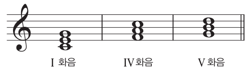
▲ 주요 3화음