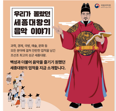
▲ 국립국악원에서 제작한 카드 뉴스