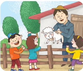
아이들이 양과 인사합니다.