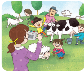
선생님께서 사 진을 찍습니다.