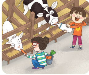
은영이가 염소에게 당 근을 줍니다.