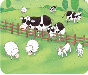
소와 양들이 풀 밭에서 놀니다.