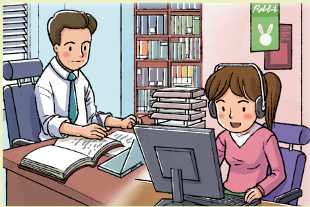
음원 관리·판매사, 음원 서비스 관리자, 음원 대리중개사 등