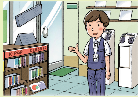
음반 제작자, 음반 도매·소매업, 음반 유통사, 음반 판매사 등