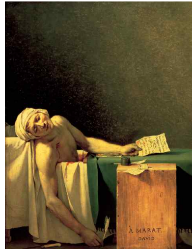
다비드 <마라의 죽음>