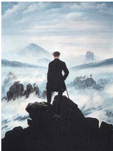
프리드리히 <안개 바다 위의 방랑자>