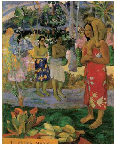
고갱 <이아 오라나 마리아>