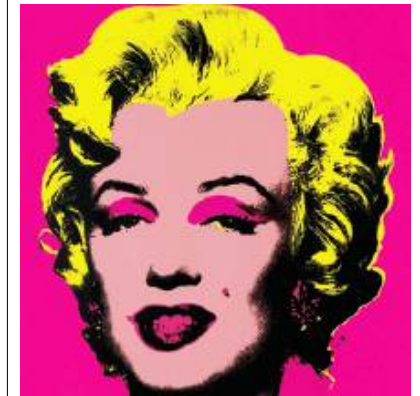
워홀 <마블린 몬로>