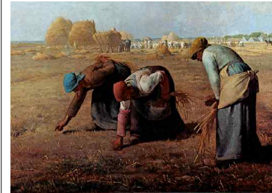
밀레 <이삭 줍는 여인들>