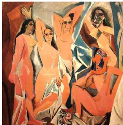
피카소 <아비뇰의 아가씨들>