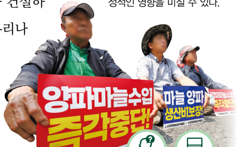
▶ 농산물 수입 중단과 가격 안정을 요구하는 농민들

보충+ 자유무역협정과 농업 넓은 농지를 기반으로 한 외국의 값싼 농산물이 수입되면 우리 농산물은 가격 경쟁력을 갖추기 어렵다. 따라서 농산물 시장을 완전히 개방하는 것은 우리 농업에 부정적인 영향을 미칠 수 있다.