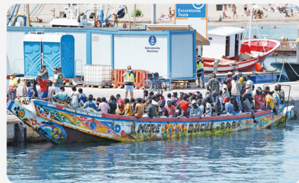
▶ 나무배를 타고 카나리아제도의 테네리페섬 항구에 도착한 난민들

세네갈에서 난민들을 태우고 유럽으로 향하던 배가 전복되는 사고가 다시 발생하였다. 국제이주기구(IOM)는 이 사고로 최소 63명이 사망했다고 밝혔다. 대서양을 건너 카나리아 제도로 향하는 이 길은 위험한 경로로 알려져 있다. 승선 인원을 초과한 나무배가 대서양의 거친 파도와 해류를 건지기 어렵기 때문이다. 지난해에도 카나리아 제도로 향하다 최소 559명의 난민이 목숨을 잃었으며, 2023년 상반기에만 126명이 사망하였다. - 『한국일보』, 2023. 8. 17.