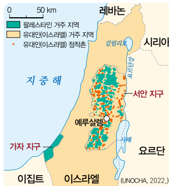
▲ 이스라엘과 팔레스타인 간 분쟁 지역